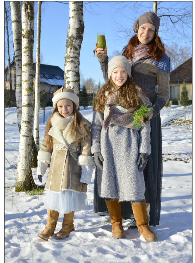
Aicinām piedalīties Ģimenes skolā!

kuru var jautri rotaļāties, veidojot dažādas figūras, kas arī lietojama kā antistresa lietiņa. Interesanta nodarbe visa vakara garumā! Slaimu ir iespējams pagatavot paša spēkiem. Kā? Nāc uz nodarbību Ģimenes skolā!